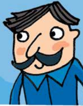
Illustration: Laima Zuloné

Autoren: Jean-Claude Pellin und Steve Brück